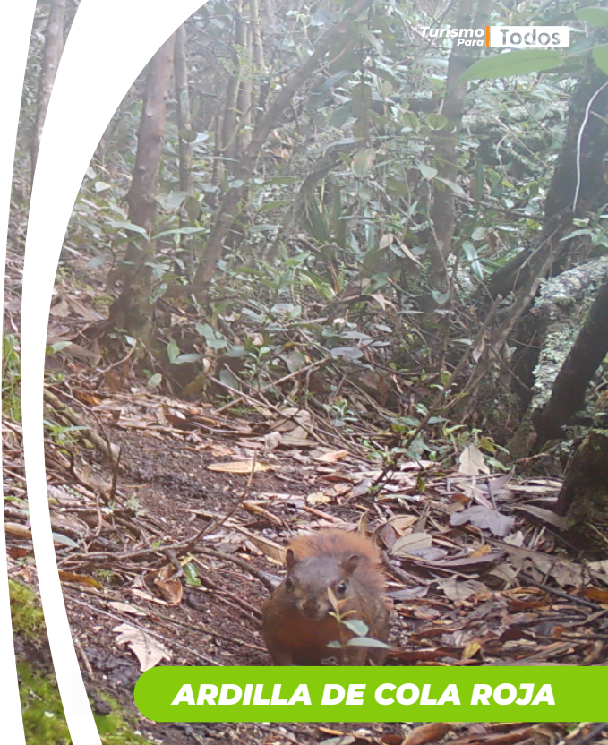
ARDILLA DE COLA ROJA