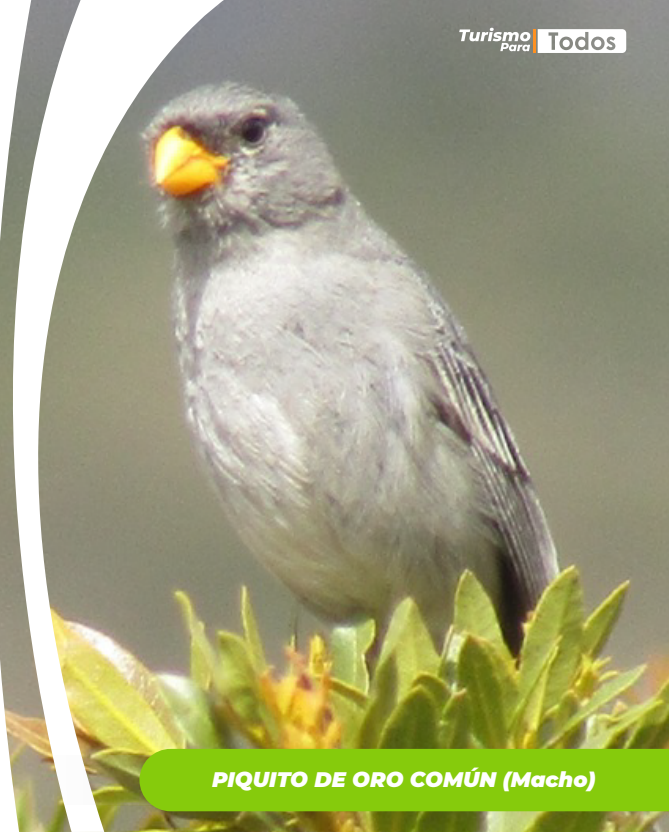
PIQUITO DE ORO COMÚN (Macho)