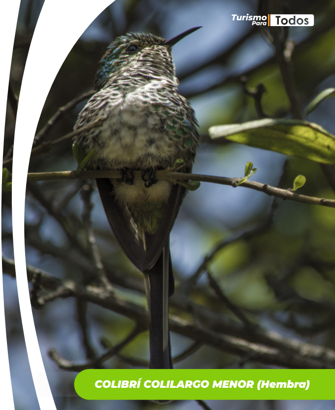
COLIBRÍ COLILARGO MENOR (Hembra)