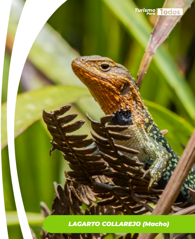
LAGARTO COLLAREJO (Macho)

Es una especie endémica de Colombia, habita en los departamentos de Santander, Boyacá, Caldas y Cundinamarca entre los 1749 - 3800 msnm. Está asociado a estratos bajos de vegetación como pajonales ( Calamagrostis spp.), es frecuente observarlos a orilla de caminos en busca de sol para regular su temperatura. La coloración en los machos puede variar de café a verde esmeralda y tienen un collar negro en la zona gular siendo un elemento de dimorfismo sexual muy evidente; las hembras y juveniles tienen coloración café en el dorso y crema ventralmente. La transformación del hábitat está poniendo en riesgo especies de saurios andinos como esta (Rodríguez-Barbosa et al., 2017).